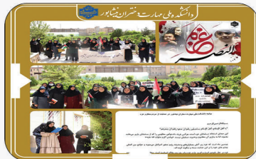
«ملی مهارت دختران نیشابور»