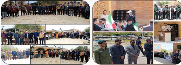
«ملی مهارت شهیدرجایی قوچان»