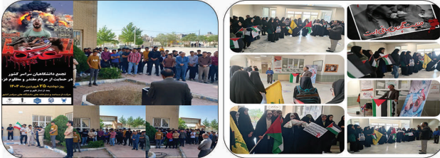
«ملی مهارت پسران سبزوار»